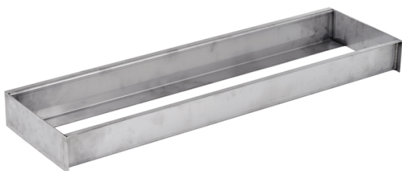
Tabla de batida de acero inoxidable (AT010)

Diseñada, fabricada y homologada conforme a la normativa de la Federación Internacional (Certificado IAAF E-99-0181).