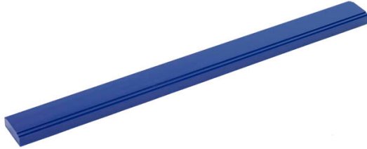
Tabla de madera maciza de pino de 10 cm de ancho mecanizada de acuerdo a la actual normativa, para el alojamiento de la plastilina.